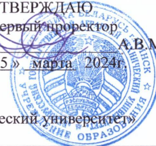
График проведения выездных занятий с выездом на производство для студентов учреждения образования «Белорусский государственный аграрный технический университет»