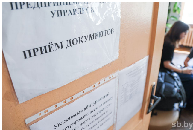
Татьяна БЕЛЕЦКАЯ