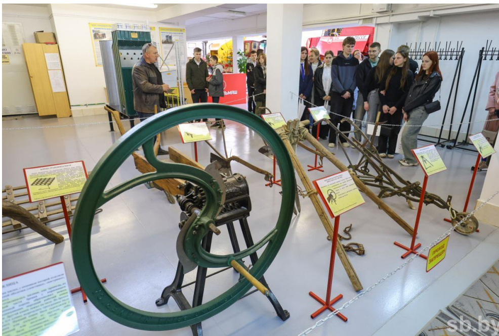
Экскурсия по выставочному павильону техники.

Преподаватели, работодатели много внимания уделяют профориентации. Упор, конечно, на старшие классы — у этих ребят в голове уже есть цели, мечты и даже алгоритм действий. В таком процессе самое главное поддержать, дать нужную информацию, направить. Как раз для этого у нас в стране и проходят различные образовательные форумы, квесты, конкурсы. Один из них в конце прошлой недели прошел в Белорусском государственном аграрном техническом университете. Накануне вступительной кампании, чтобы точно определиться с поступлением, сюда приехали ученики агроклассов Минщины. О дальнейших планах школьников, фишках агрофорума «5 шагов к качеству» рассказываем в репортаже «СГ».