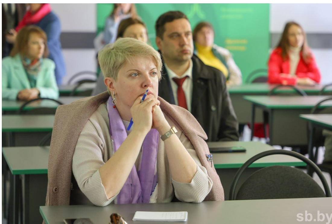
Учителя агроклассов на лекции преподавателей БГАТУ.

— Два года назад мой ученик завоевал третье место на международном конкурсе «Агро-НТРИ» в номинации «Добропчел», — дополняет педагог. — В этом году тоже дошли до финала. Конкурс был сумасшедший! К сожалению, не все прошли. Но ученикам так нравятся эти технологии! Многому и меня научили. Сегодня мы воочию видим: сельское хозяйство не стоит на месте, оно автоматизируется, совершенствуется. Самых активных, преуспевающих в учебе ребят настраиваю на сельхозсферу. Прямо так и говорю: со своими навыками и амбициями вы будете хорошо зарабатывать, а может, даже станете министрами.