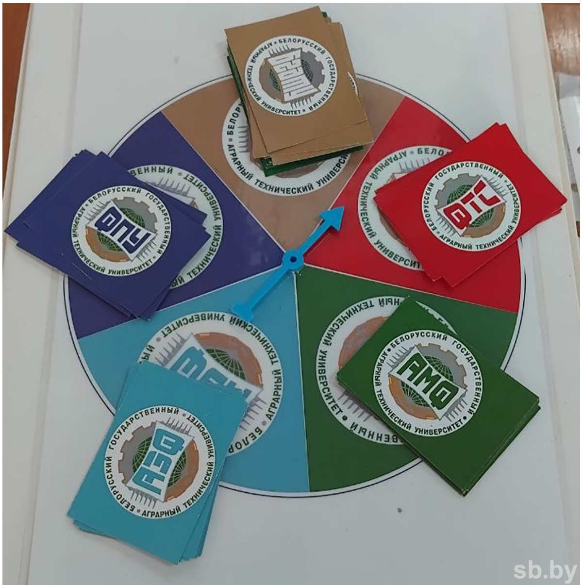
Пять факультетов БГАТУ.