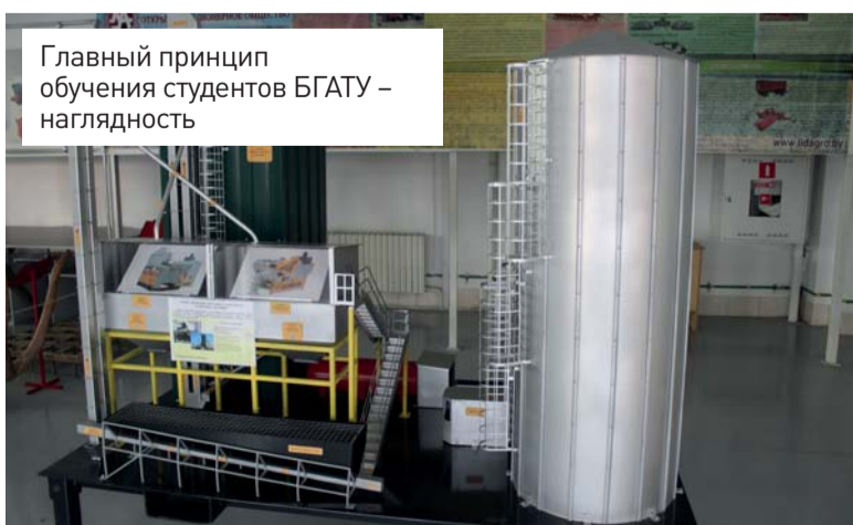
Главный принцип обучения студентов БГАТУ – наглядность

С условиями поступления можно ознакомиться на сайте университета www.bsatu.by в разделе «Абитуриенту/Правила приема в БГАТУ»