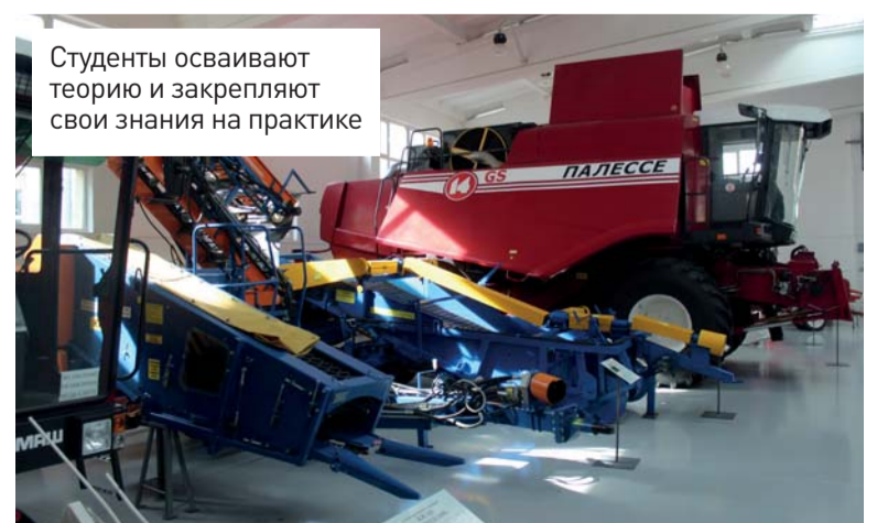
Студенты осваивают теорию и закрепляют свои знания на практике

С условиями поступления можно ознакомиться на сайте университета www.bsatu.by в разделе «Абитуриенту/Правила приема в БГАТУ»